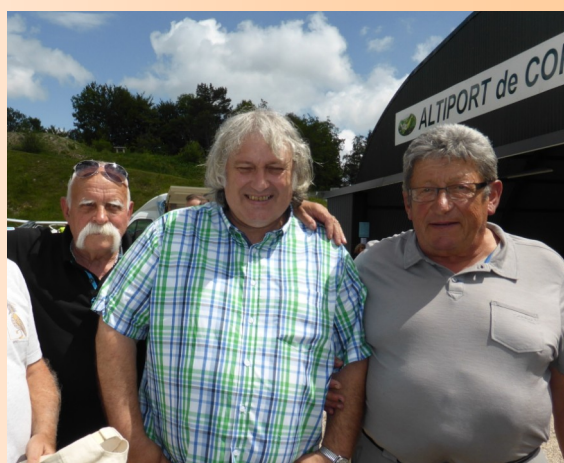
M Le Maire de Corlier au centre.