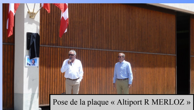
Pose de la plaque « Altiport R MERLOZ »