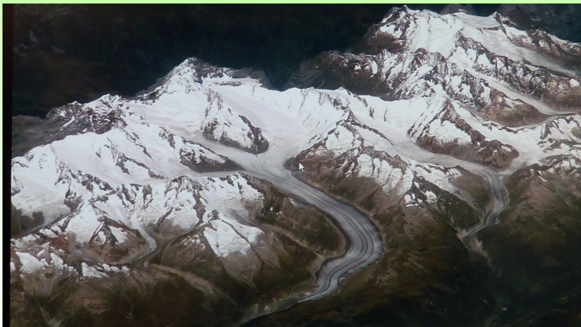
Le glacier d'ALETSCHE vu de l'espace, dans le Valais,(23 km de long), les 3 névés se rejoignent place de la concorde.