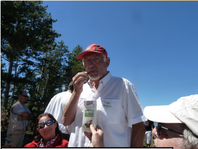
Du chocolat à la Williamine, une spécialité suisse.