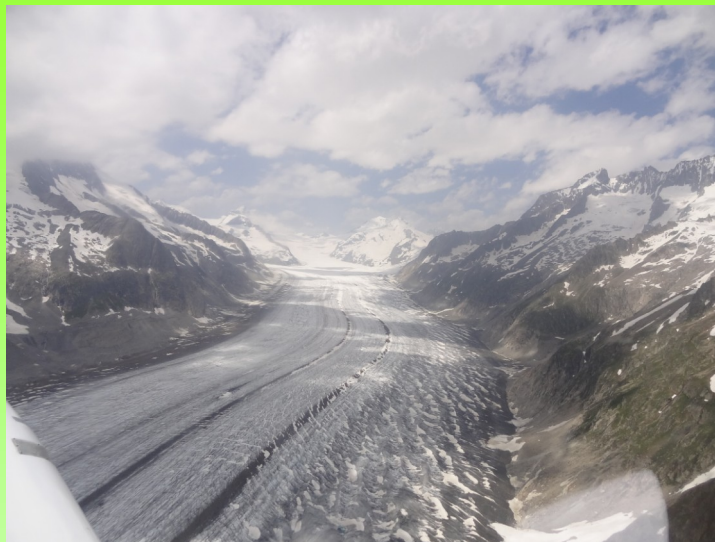
Vers Konkordiaplatz. Il faut +de 15 mn pour remonter la moraine et le névé vers le Mönch (4110 m) ou Jungfrau.