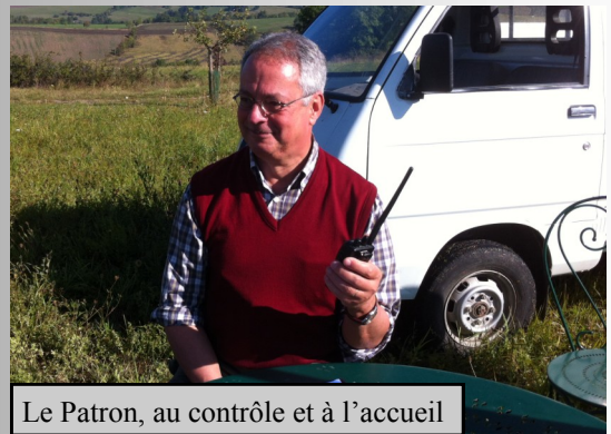
Le Patron, au contrôle et à l'accueil

Beaucoup d'ULM pour ce rassemblement. Un temps estival. Nous avons eu la visite de la BGTA de ST Geoirs